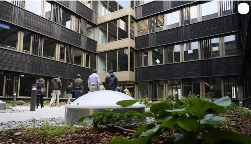
La technique du bois brûlé a été utilisée pour les façades du Bâtiment B. Jean-Baptiste Morel