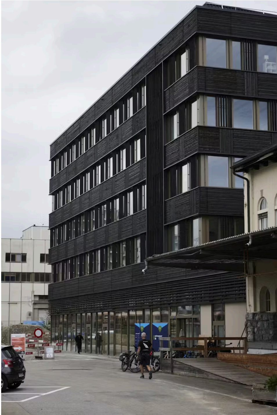
Le nouvel édifice est collé au bâtiment abritant le restaurant les Menteurs. Jean-Baptiste Morel